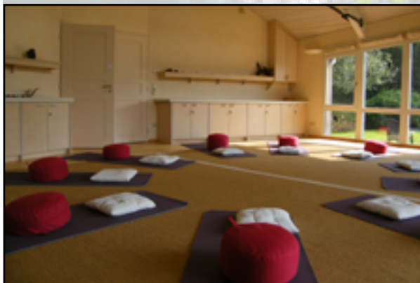
Workshopruimte Het Jagershuisje

Uit: Love of Beauty , blz. 78, van Tarthang Tulku