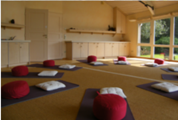
Workshopruimte Het Jagershuisje